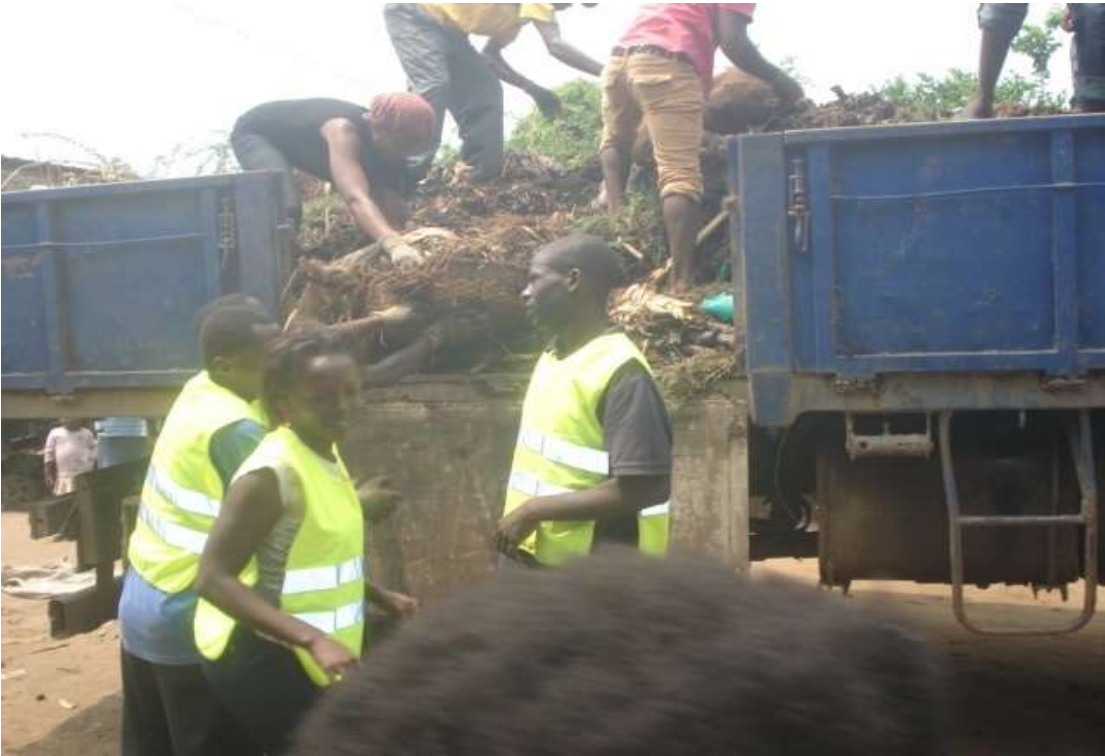
Chargement des camions vers la zone de décharge